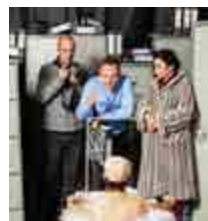
שליחותו של הממונה משאבי אנוש