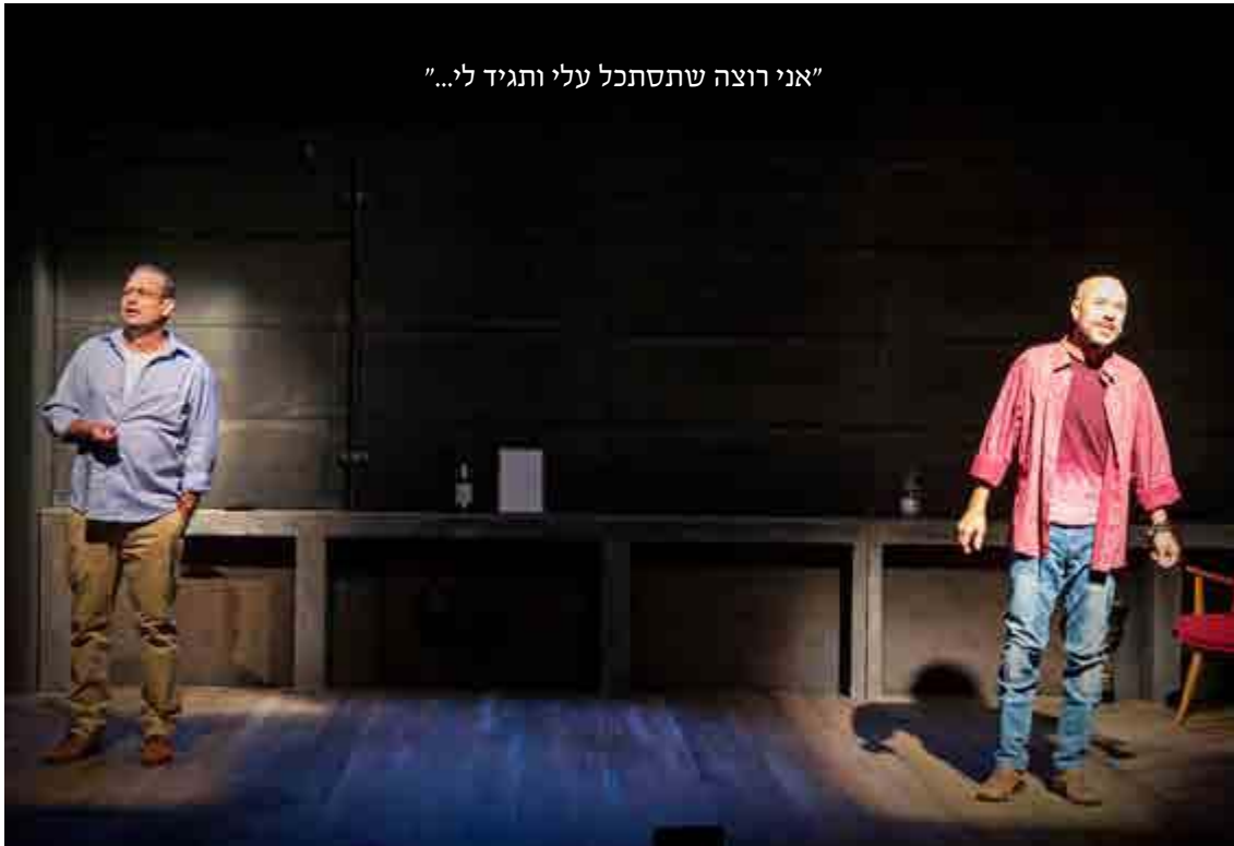
"אני רוצה שתסתכל עלי ותגיד לי..."