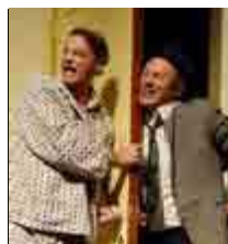
הרטיטי את לבי