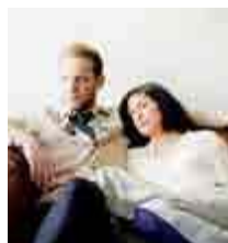
תמונות מחיי נישואין