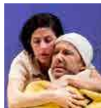
אשה בורחת מבשורה