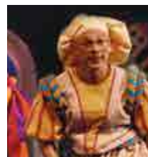
עוץ לי גוץ לי