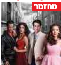
מחזמר סיפור הפרברים